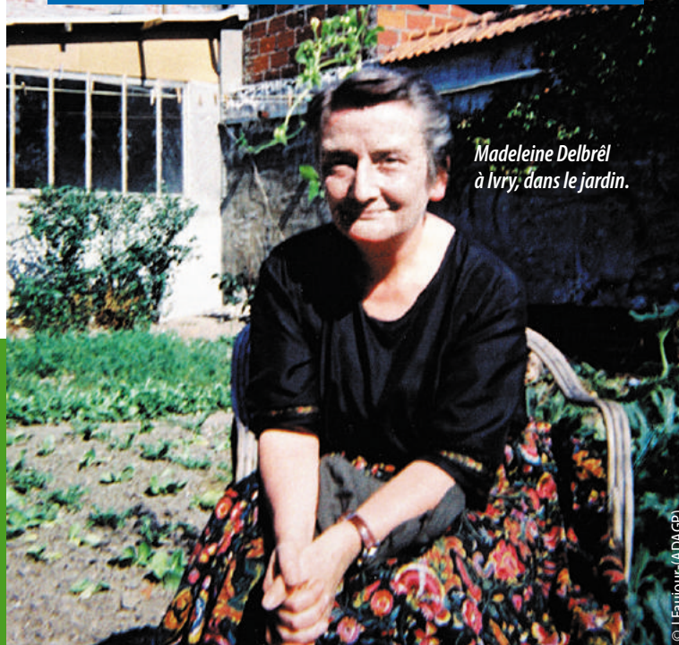
Madeleine Delbrêl à Ivry, dans le jardin.